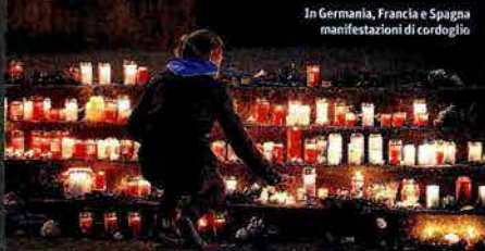
In Germania, Francia e Spagna manifestazioni di cordoglio

Marcoussanel con il reportage di Mariano Mauerger • pagina 8