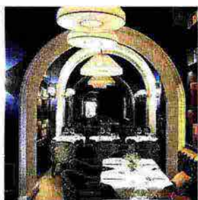
Restyling. Nuove salette